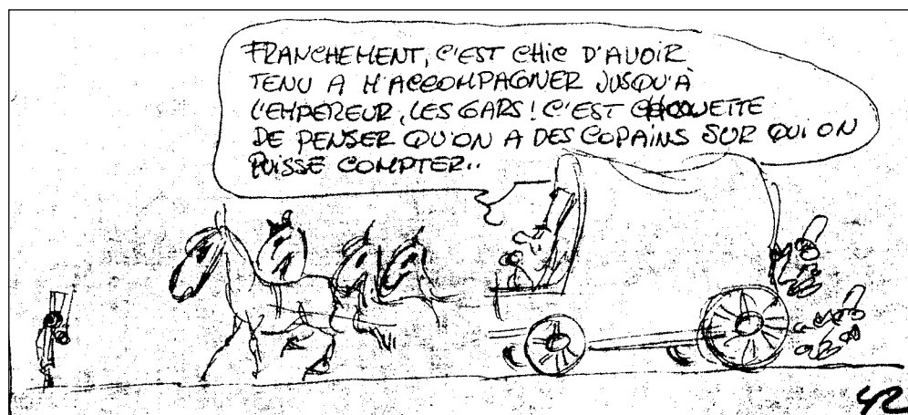
Het laatste prentje van bladzijde 44 van "Wagens in de steppe" door Cauvin.

RAOUL CAUVIN 'Dat varieert. De reeks Sammy bezorgt me heel wat minder opzoekingswerk dan bijvoorbeeld De Blauwblozen of Vrouwen in 't wit. 'Uit het leven gegrepen'-documentatie of achtergrondinfo voor G. Raf Zerk wens ik mezelf nog niet toe want daarvoor zou ik het hoekje om moeten gaan en dat vind ik net iets te verre gaand (lacht). TVDW