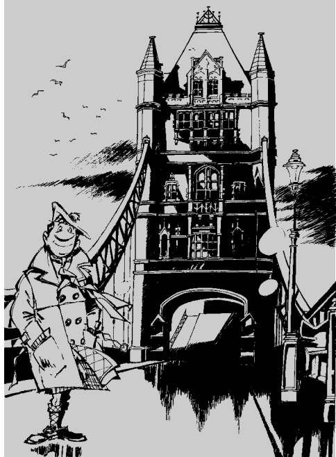
© J. VAN DER BRUG / ZIMMERMAN / NIEB ©

Het jaar 2007 staat bij vzw Arcadia helemaal in het teken van het getal 10. Arcadia blaast immers maar liefst 10 verjaardagskaarsjes uit én is tegelijkertijd ontzettend verheugd het nieuwe stripjaar in te luiden met een 10de Mick Mac Adam-album. De avonturen van deze pientere Schotse speurder zijn nog maar net uitverteld in de roemrijke 'kleine reeks' van Arcadia of Mick Mac Adam maakt alweer zijn opwachting in de prestigieuze Collectie Millennium 2000.