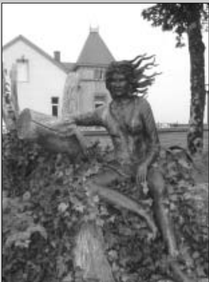
Het standbeeld van Bosliefje in Florenville

Op een steenworp van Frankrijk ligt het typische Gaume-stadje Florenville, omgeven door uitgestrekte bossen en met een indrukwekkende neogotische kerk uit 1873 als een van de attractiepolen. In de schaduw van dit bouwwerk kijkt Bosliefje, in de vorm van een sensueel vormgegeven standbeeld van de hand van Francis Darasse, uit over de goege-