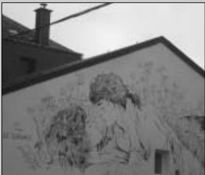
De muurschildering van Servais in Florenville

Op een steenworp van Frankrijk ligt het typische Gaume-stadje Florenville, omgeven door uitgestrekte bossen en met een indrukwekkende neogotische kerk uit 1873 als een van de attractiepolen. In de schaduw van dit bouwwerk kijkt Bosliefje, in de vorm van een sensueel vormgegeven standbeeld van de hand van Francis Darasse, uit over de goege-